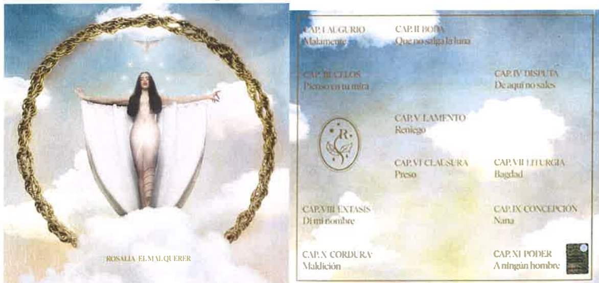
Portada y contraportada del álbum 'El mal querer'.

Antes de la publicación del álbum se lanzaron tres sencillos: «Malamente», «Pienso en tu mirá» y «Di mi nombre». Posteriormente se lanzaron los videoclips de «Bagdad» y «De aquí no sales», que se convirtieron en éxitos virales debido a su estética y simbolismo poético. Otras iniciativas promocionales incluyeron la exhibición de una valla publicitaria en Times Square, así como presentaciones en vivo en varios festivales españoles y en los MTV Europe Music Awards 2018.