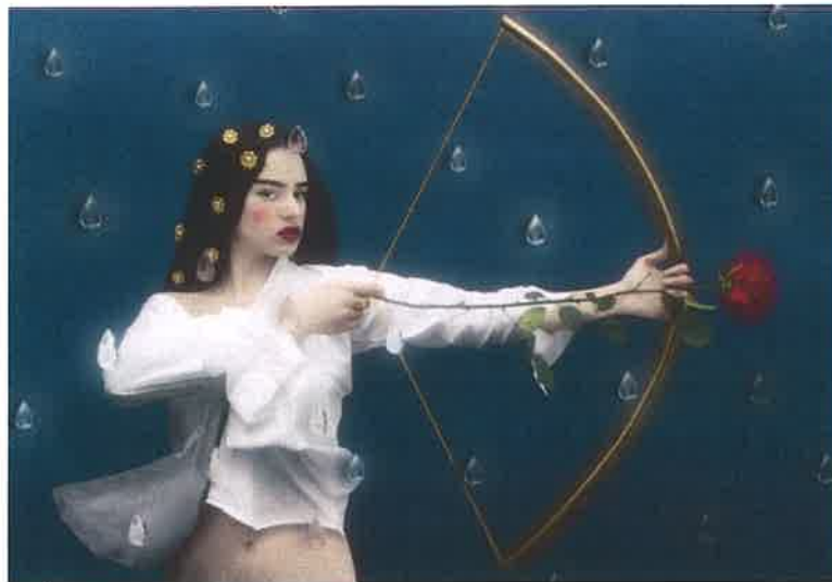
Imagen utilizada para el clip de “A NINGÚN HOMBRE- Cap.11: Poder”

Para empezar, presentaremos brevemente a la autora del álbum. En segundo lugar, estudiaremos el álbum en sí. Y acabaremos analizando la letra de la onceava canción de este último, A NINGÚN HOMBRE- Cap.11: Poder .